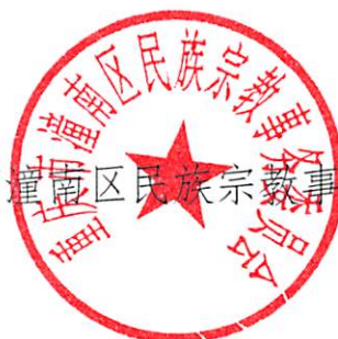
重庆市潼南区民族宗教事务委员会