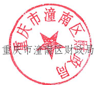
重庆市潼南区财政局

〔2021〕6号）精神，根据重庆市财政局等6部门关于印发《重庆市财政衔接推进乡村振兴补助资金管理实施办法》的通知要求，为加强和规范资金使用管理，提升资金使用效益，结合我区工作实际，特制定《潼南区财政衔接推进乡村振兴补助资金管理实施办法》，现印发你们，请遵照执行。