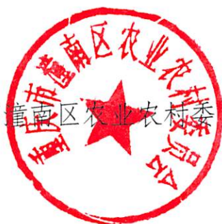
重庆市潼南区农业农村委员会